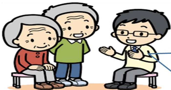
栄養ケアサポート薬局(薬剤師)

栄養ケアサポート薬局は、高齢者のフレイル(虚弱)の起因となる低栄養を予防する薬局です。